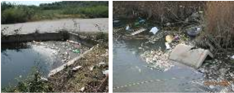
Εικ. 1.2. Παραδείγματα συσσώρευσης απορριμμάτων σε αρδευτικούς αύλακες που καταλήγουν σε λιμνοθαλάσσια οικοσυστήματα της επικράτειας αλλά και παράδειγμα υποβάθμισης της ποιότητας των υδάτων.

Οι λιμνοθάλασσες είναι περιοχές παθητικής συσσώρευσης απορριμμάτων που προέρχονται τόσο από τη στεριά όσο και από τη θάλασσα. Τα απορρίμματα αυτά δυσχεραίνουν και την αλιευτική δραστηριότητα.