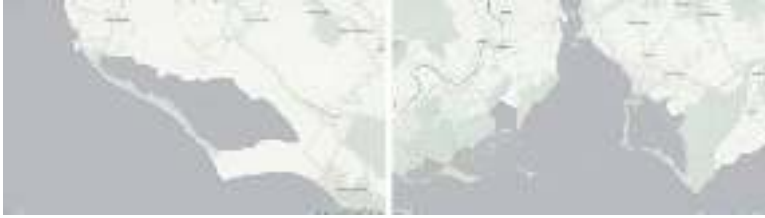
Εικ. 1.1. Τυπικά δείγματα λιμνοθάλασσας κλειστού (αριστερά, λ/θ Κορινθίων, Κέρκυρα) και ανοικτού τύπου (Κεντρική λ/θ Μεσολογίου).

τις διακρίνει σε ανοικτού και κλειστού τύπου. Τα στερεά απορρίμματα συνιστούν και αυτά εμπόδιο όταν συσσωρεύονται στους στενούς διαύλους, ανεξάρτητα αν προέρχονται από την ανοικτή θάλασσα ή το εσωτερικό της λιμνοθάλασσας.