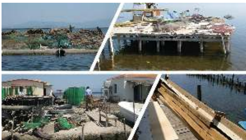
Εικ. 1.3. Παραδείγματα συσσώρευσης υλικών «εν δυνάμει απορριμμάτων» σε λιμνοθάλασσα οικοσυστήματα της επικράτειας.